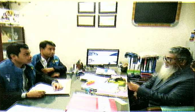
দুদক অভিযোগকেন্দ্র-১০৬-এ অভিযোগের ভিত্তিতে তাৎক্ষণিক অভিযান।