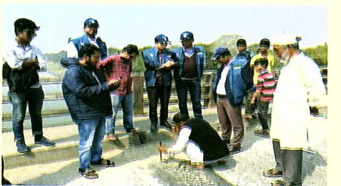
দুদক অভিযোগকেন্দ্র-১০৬-এ অভিযোগের ভিত্তিতে তাৎক্ষণিক অভিযান।

মানুষ ঘুষ দেয়া বন্ধ করলে, ফাইল আটকে রাখারও অবসান ঘটবে দুর্নীতিকে না বলি