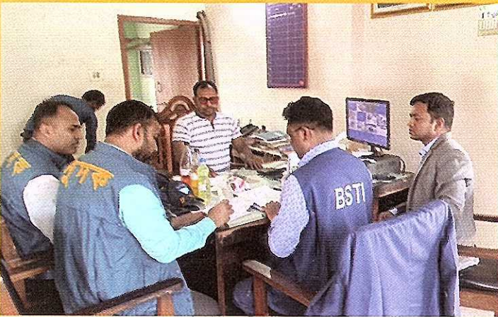
দুদক অভিযোগকেন্দ্র-১০৬-এ অভিযোগের ভিত্তিতে তাৎক্ষণিক অভিযান।