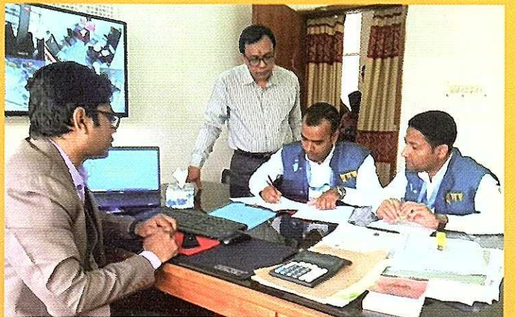
দুদক অভিযোগকেন্দ্র-১০৬-এ অভিযোগের ভিত্তিতে তাৎক্ষণিক অভিযান।

মানুষ ঘুষ দেয়া বন্ধ করলে, ফাইল আটকে রাখারও অবসান ঘটবে দুর্নীতিকে না বলি